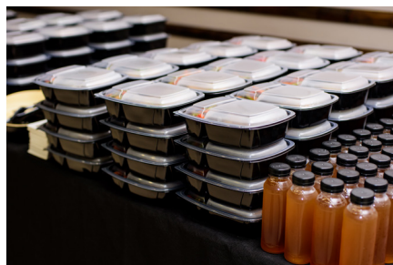
식사 및 다과를 포함한 케이터링 서비스

교육연수의 일환으로 본 대학원 과정을 현업과 병행하는 재학생들의 편의를 위하여 금, 토 수업 전후로 식사 및 다과를 포함한 케이터링 서비스가 제공되며, 수강하는 모든 교과목의 강의교재를 매 학기 개인별로 제공하여 제한된 주말 시간 동안 학업에만 전념할 수 있도록 우수한 교육환경이 조성되어 있습니다.