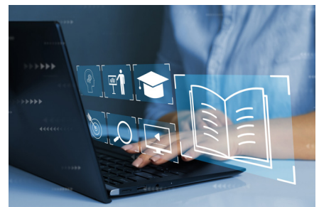
매 학기 강의교재 제공